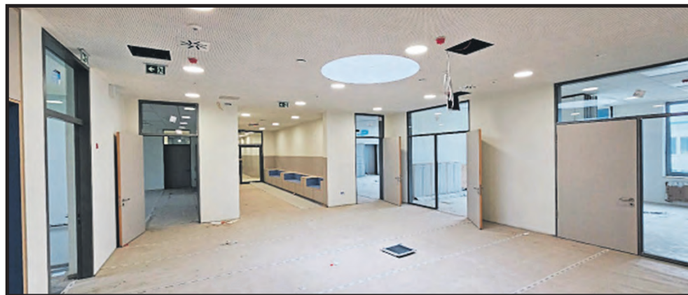
Regionalschule 3. OG

Die Ausbaugewerke und technischen Gewerke befinden sich in der Endphase.