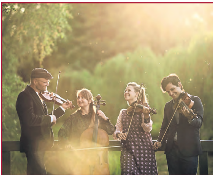
Das Danish Fiddle Quartet

Neuigkeiten über Veranstaltungen und Sonderausstellungen gibt es unter www.museum-hagenow.de oder auf Instagram @hagenow_museum.