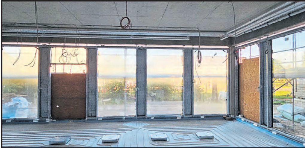
Fassadenelemente EG Musikraum