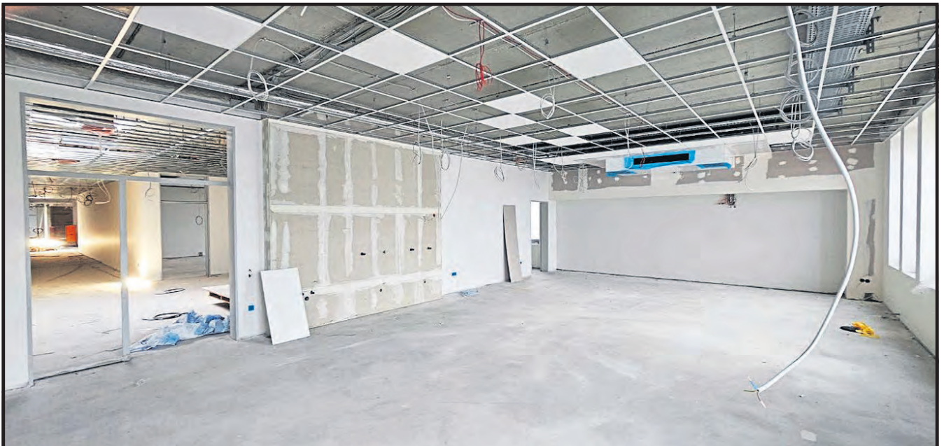
Trockenbauarbeiten in der Grundschule