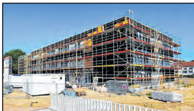
Grundschule - Fassadenarbeiten