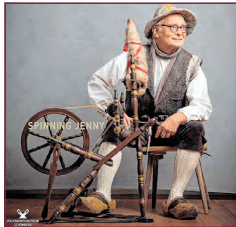
Ehrenamtlicher mit historischem Spinnrad

Entstanden ist die Ausstellung im Volkskundemuseum Schönberg unter Federführung von Olaf Both während der Corona-Pandemie. Gemeinsam mit dem Fotografen Heiko Preller entwickelte er ein Konzept, um der Öffentlichkeit einen Eindruck von der unabdingbaren Unterstützung durch die Ehrenamtlichen zu vermitteln. Gleichzeitig zeugen die Fotografien von der Begeisterung der Menschen für das kulturelle Erbe ihrer Region und die kulturhistorischen Exponate im Museum.