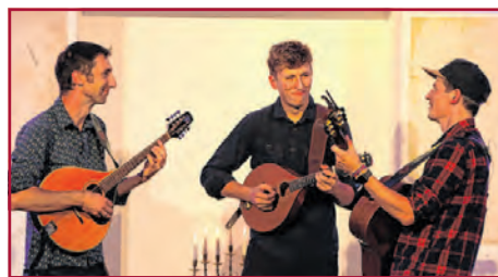
Snaarmaarwaar aus Belgien

Das Trio Snaarmaarwaar aus Belgien wagte den Anfang und begann zunächst mit einem ruhigen Stück, bevor sie die Stimmung mit einem belgischen Neujahrshit