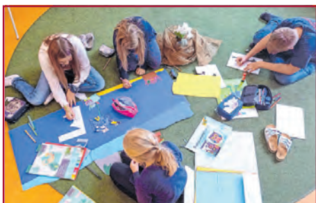
Schülerinnen und Schüler bei der Arbeit

Hunderte kleine Künstler*innen an den Hagenower Schulen nutzen die Zeit, um für die Ausstellung Druckgrafiken anzufertigen. Es wird gebastelt, geklebt, gezeichnet und natürlich gedruckt. Neben der Herstellung der vielfältigen Kunstwerke übernehmen die SchülerInnen mit der Unterstützung ihrer LehrerInnen auch die Organisation und Durchführung des Rahmenprogramms der Vernissage und der späteren Finissage.