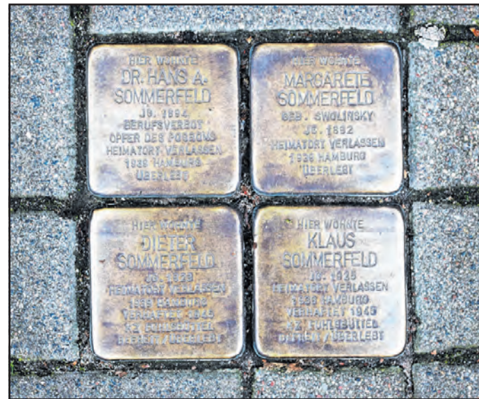
Stolpersteine der Familie Sommerfeld in der Bahnhofstraße 4

Bei den Stolpersteinen handelt es sich um kleine Gedenktafeln aus Messing, die in den Gehweg eingelassen sind. Auf ihnen sind Namen, Geburtsjahr, Deportationsjahr und -ort sowie weitere Angaben zum Schicksal des Betroffenen eingraviert. Die Stolpersteine sind ein Projekt des Künstlers Gunter Demnig. Bereits 1992 begann er kleine Gedenksteine im Boden einzulassen. Sie markieren die letzte freigewählte Wohnstätte dieser Menschen. Die Steine dienen als Erinnerung an die Vertreibung und Vernichtung der Juden, Zigeuner, Sinti und Roma, der politisch Verfolgten, der Homosexuellen, der Zeugen Jehovas und der Euthanasieopfer.