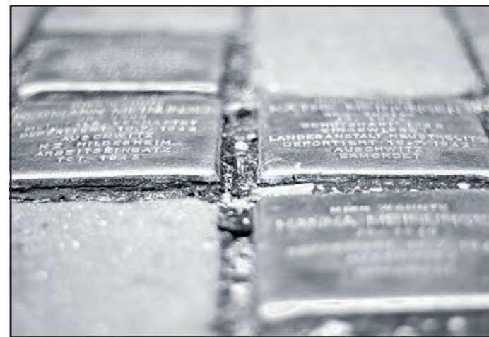
Die Stolpersteine in der Langen Straße 108

In der Langen Straße 108 wurden 2009 die Stolpersteine für die Familie Meinungen verlegt, in der Parkstraße 33 für die Familien Meyerheim und Davidsohn und in der Bahnhofstraße 4 für die Familie Sommerfeld.