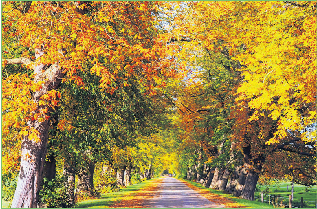
„Herbstallee Redefin“ von Annett Strohbehn

Die zweite LEADER-Fotoausstellung „Lieblingsorte – faszinierend bunt“ macht auf ihrer Wanderschaft durch die Region Halt in Hagenow. Am Sonntag, den 8. März 2020, um 15.00 Uhr findet die Vernissage in der Alten Synagoge statt. Die Ausstellung entführt zu den unterschiedlichen Lieblingsorten in der Griesen Gegend. Eine Auswahl von 35 Bildern lädt ein zu einer abwechslungsreichen Reise durch die weiten Kiefernwälder, die Wiesen und Felder, unternimmt einen Abstecher an die Elbe und in den Schlosspark Ludwigslust und zeigt die Vielfältigkeit und Schönheit der Tier- und Pflanzenwelt.