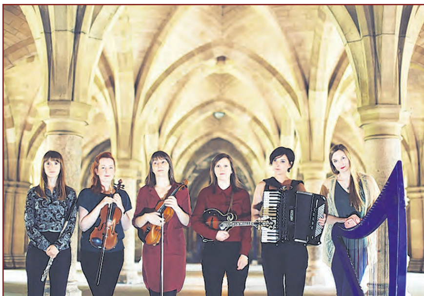
The Shee verbinden schottischen Folk, gälische Lieder und amerikanischen Bluegrass zu einem unverwechselbaren Stil

Karten gibt es im Vorverkauf in der Hagenow-Information, Lange Straße 79, 19230 Hagenow, 03883/729096, e-mail: hagenow-info@hagenow.de. Vorbestellte und per Überweisung bezahlte Karten können ab 19.00 Uhr an der Abendkasse abgeholt werden.