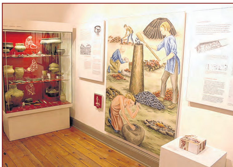
Blick in die Ausstellung zur Vor- und Frühgeschichte im Museum für Alltagskultur der Griesen Gegend in Hagenow.

Am Donnerstag, den 10. Oktober 2019 stellt der Archäologe in Hagenow die Funde und die Geschichte ihrer Entdeckung vor und ordnet sie in das historische Geschehen der Römischen Kaiserzeit ein. Eine kurze Führung durch die Ausstellung beginnt um 17.30 Uhr im Museum (Lange Straße 79); der Vortrag beginnt um 19.00 Uhr in der Alten Synagoge (Hagenstraße 48). Mehr Informationen gibt es unter www.museum-hagenow.de