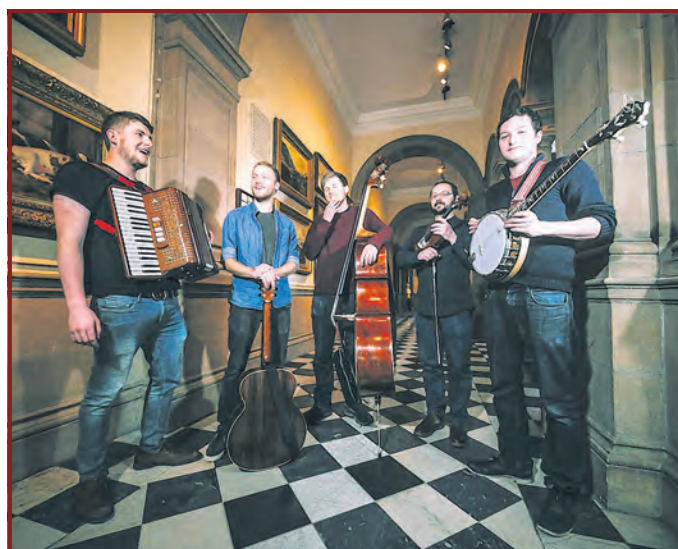
Dallahan stammen aus Irland, Schottland und Ungarn

genow-info@hagenow.de. Vorbestellte und per Überweisung bezahlte Karten können ab 17.00 Uhr an der Abendkasse abgeholt werden.