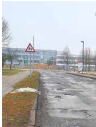
Standort ist klar und eindeutig