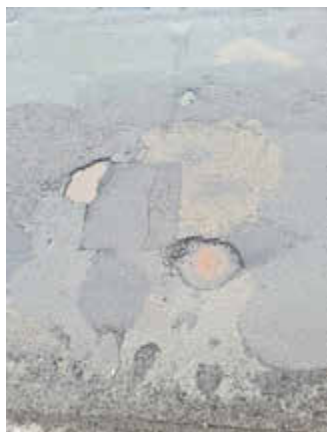
Position ist nicht zu lokalisieren

Auch der Zeitpunkt oder eine zeitliche Eingrenzung der Beobachtung kann für die weitere Bearbeitung entscheidend sein.