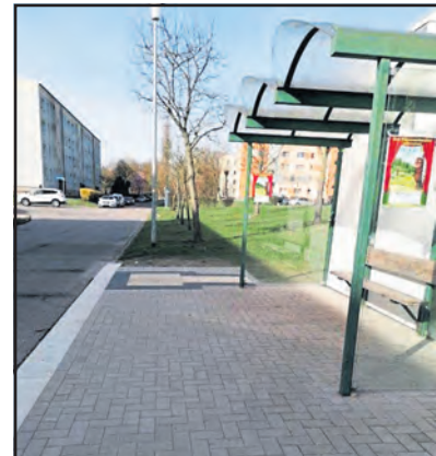
Haltestelle Kießender Ring

Die Stadt Hagenow möchte sich bei allen am Projekt beteiligten bedanken, die zum Gelingen des Vorhabens beigetragen haben.